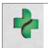
M3 flach an Wand